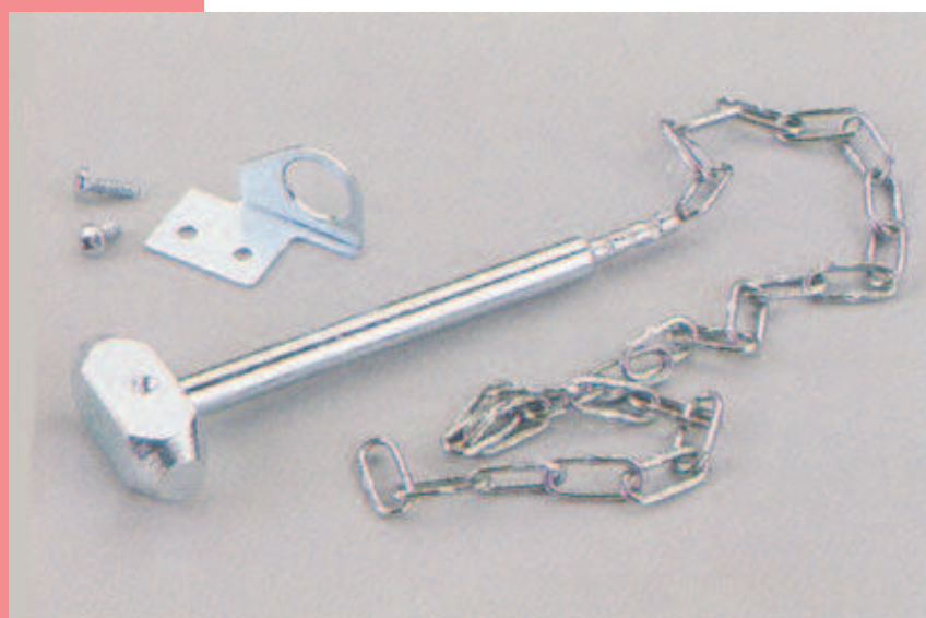
Art. 1471 Hammer